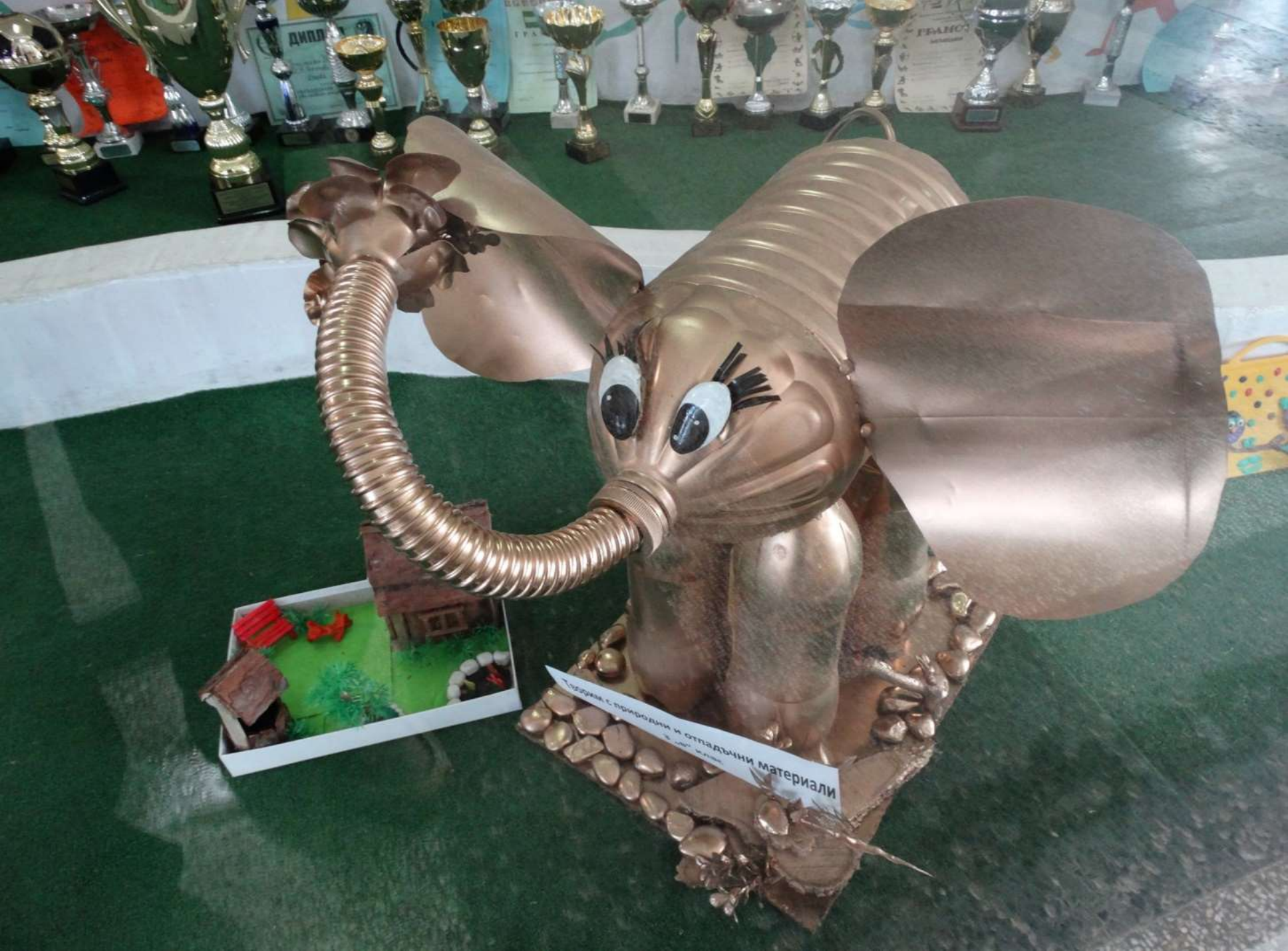
Скульптура «Природы и отпадочны материалы» С. 1000 г. 2010 г.